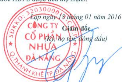
TRẦN QUANG DŨNG